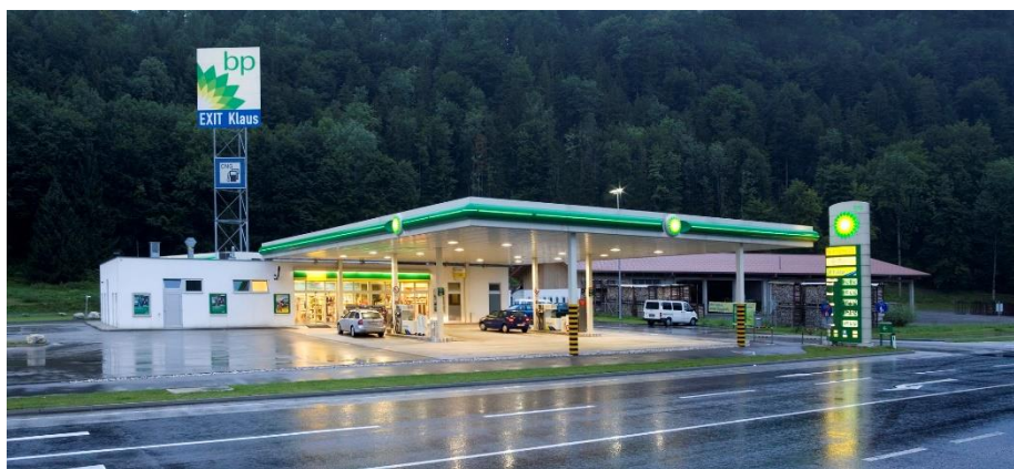
Doppler BP Tankstelle in Klaus im alten Design

Damit begann der Aufbau der Tankstellenmarke Turmöl. Die Doppler Gruppe hat mit Juni 2021 260 Tankanlagen österreichweit. Mit 228 Turmöl Stationen ist Turmöl damit die größte, private Diskontkette Österreichs und rangiert unter den internationalen Mineralölmarken.