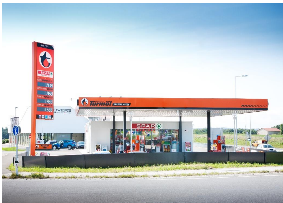
Turmöl Tankstelle in Pasching im alten Design