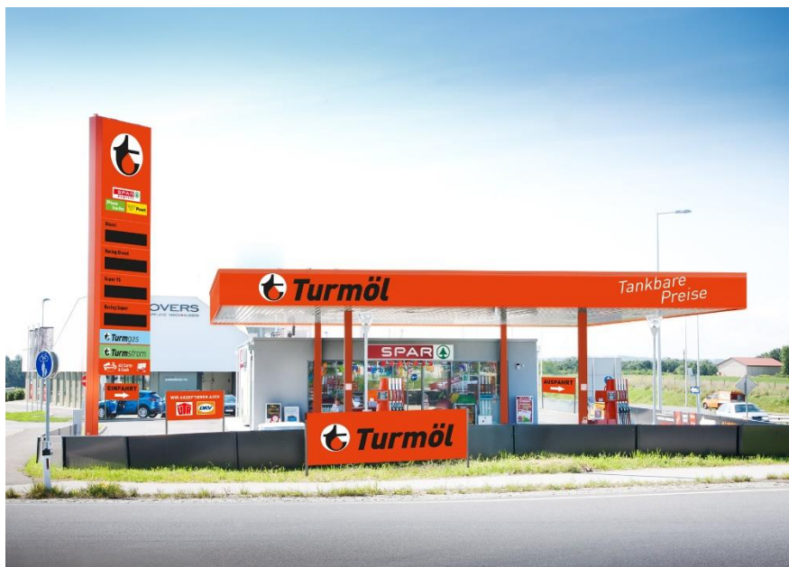
Visualisierung Turmöl Tankstelle im neuen Design in Pasching